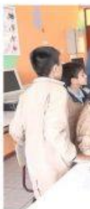
LAS ACTIVIDADES Y HERRAMIENTAS TECNOLÓGICAS COMO EL PROGRAMA