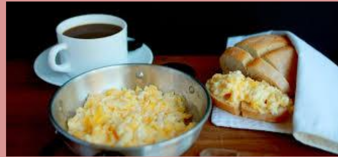
Pan con huevo