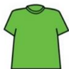
Camiseta de mangas cortas