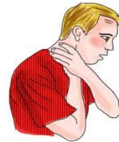
dificultad para respirar