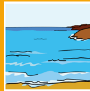
Las olas del mar