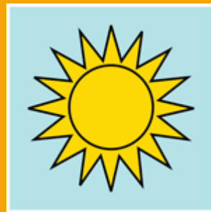
los rayos del Sol