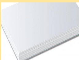
HOJA DE BLOCK

Pongamos en práctica y manos a la obra con la Técnica estampado con botellas plásticas para crear observa el siguiente video con la explicación.