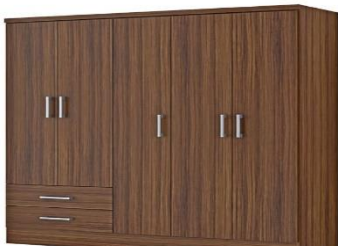
El armario mide 8 metros de ancho