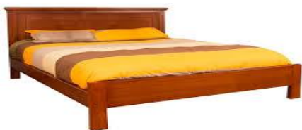
La cama mide 10 metros de largo.