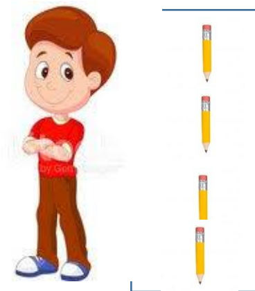
El niño mide 4 lápices de alto