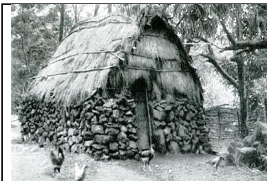
PUEBLO RAPA NUI