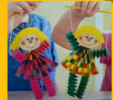
⇒ Marioneta en origami