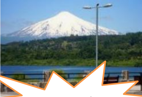
Natural (volcán de Villarrica)