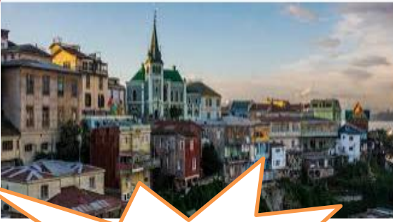
Material (casas de Valparaíso)