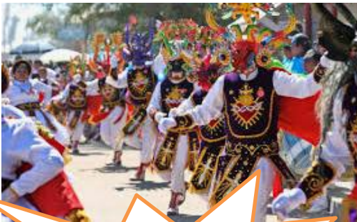
Inmaterial (baile la tirana)

✚ Patrimonio cultural inmaterial: constituye el patrimonio intelectual y el sentido que hace única a una comunidad, como las tradiciones, la gastronomía, la herbolaria, la literatura, las teorías científicas y filosóficas, la religión, los ritos y la música, así como los patrones de comportamiento que se expresan en las técnicas, la historia oral, la música y la danza.