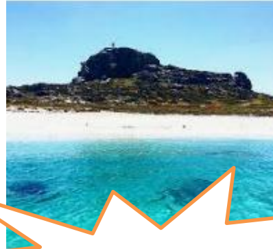
Natural (Punta choros- La Serena)

✚ Patrimonio cultural inmaterial: constituye el patrimonio intelectual y el sentido que hace única a una comunidad, como las tradiciones, la gastronomía, la herbolaria, la literatura, las teorías científicas y filosóficas, la religión, los ritos y la música, así como los patrones de comportamiento que se expresan en las técnicas, la historia oral, la música y la danza.