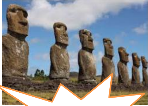
Material (Moais de la Isla de Pascua)