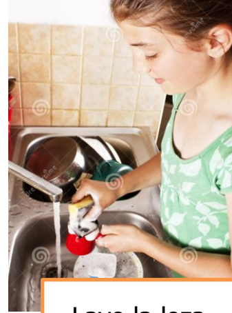
Lavo la loza.

Si tienes otra responsabilidad dentro del hogar debes escribirla: