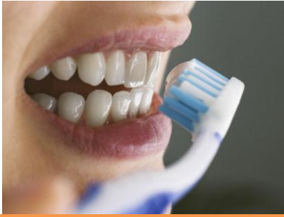
Me lavo los dientes