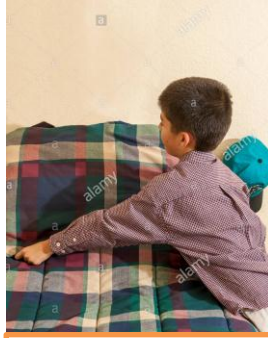
Hago mi cama