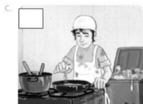
Cocinar con utensilios sucios.