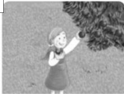
Sacar frutas y comérselas directamente del árbol