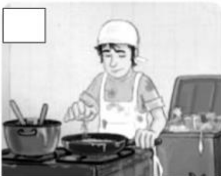
Cocinar con utensilios sucios.