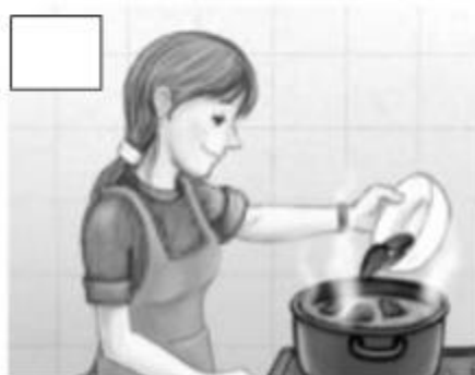
Cocinar debidamente los mariscos.