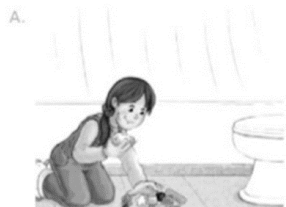
Comer alimentos y jugar en el baño.

7.-Observa las siguientes situaciones y marca la correcta frente a una buena acción de cuidado de la salud .