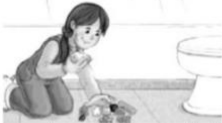
Comer alimentos y jugar en el baño.

7.-Observa las siguientes situaciones y marca la correcta frente a una buena acción de cuidado de la salud .