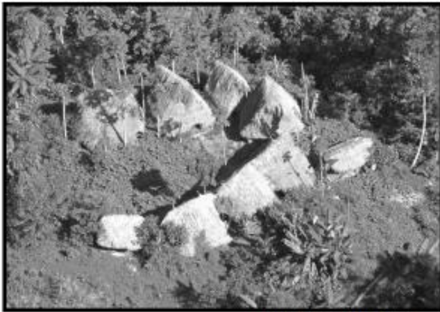
Pueblo amazónico Brasil