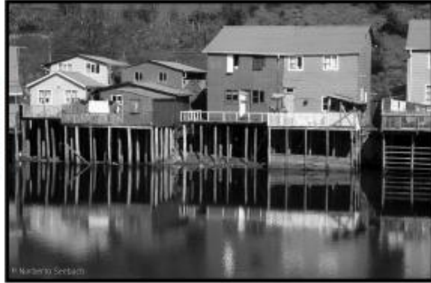
Palafitos de Chiloé Chile