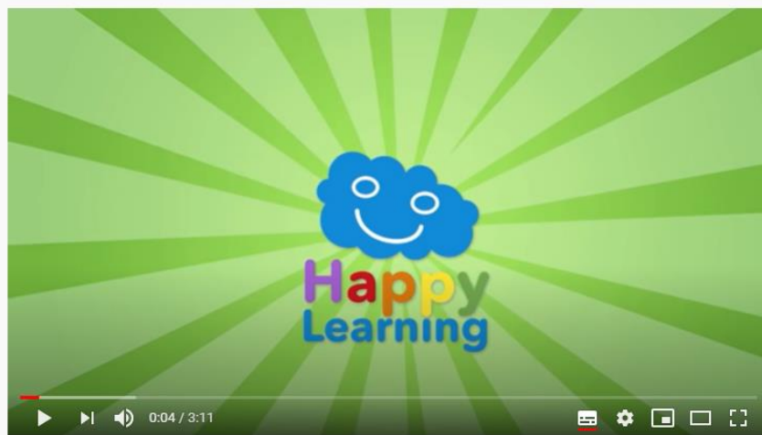
El Sistema Solar | Videos Educativos para Niños

https://www.youtube.com/watch?v=ZykXgSget6A