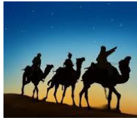
Los reyes magos