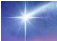
la estrella de Belén