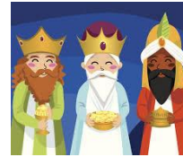
los reyes magos