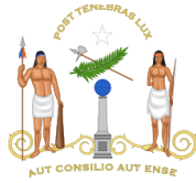
El primer Escudo de Chile