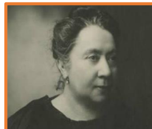
Eloísa Díaz Insunza

Ella es _____ la primera mujer chilena y de sudamericana en ser _____.