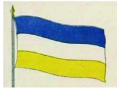
La primera Bandera de Chile