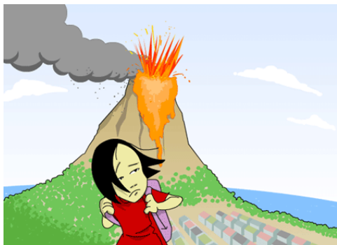
EXPLOSIÓN DE VOLCÁN